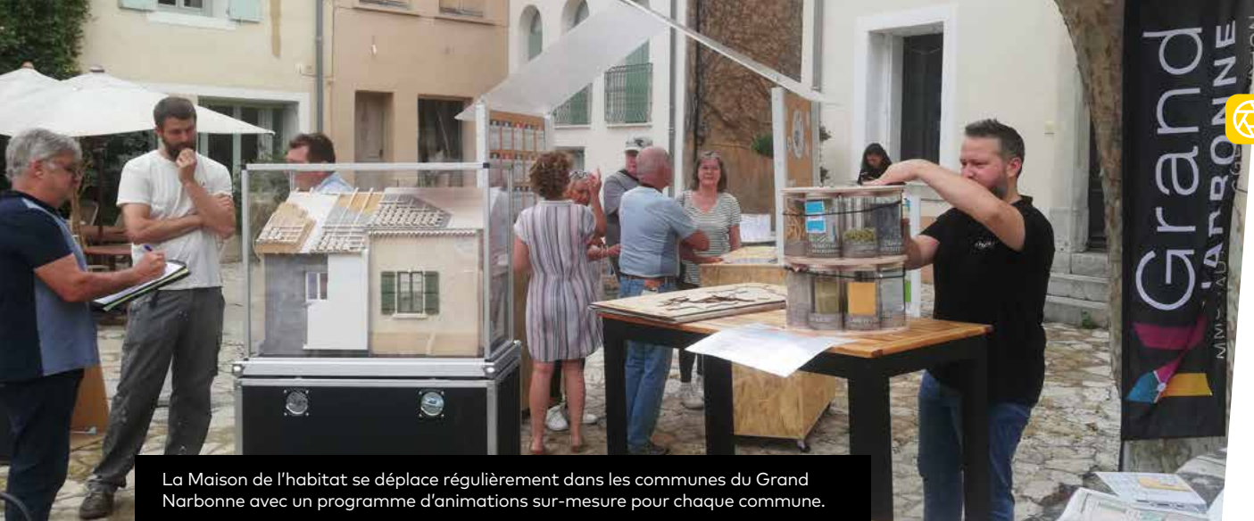
La Maison de l'habitat se déplace régulièrement dans les communes du Grand Narbonne avec un programme d'animations sur-mesure pour chaque commune.