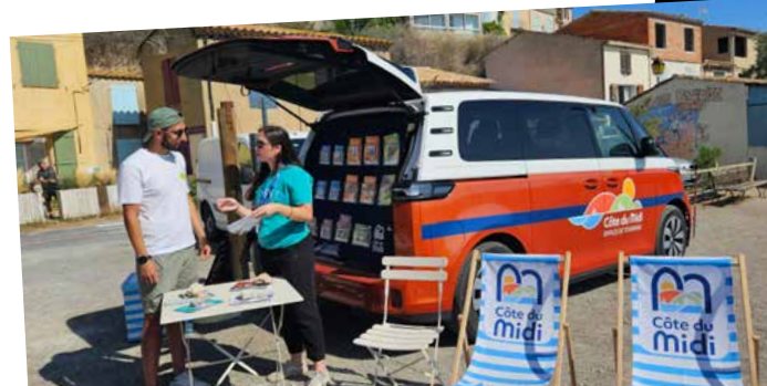
Le combi de l'Office de tourisme sillonne le territoire tout l'été. Habillé aux couleurs de notre destination, la Côte du Midi, il fait escale dans les villages et lors des événements festifs. Habitants et visiteurs y trouvent conseils et infos pratiques pour découvrir les richesses de la destination.