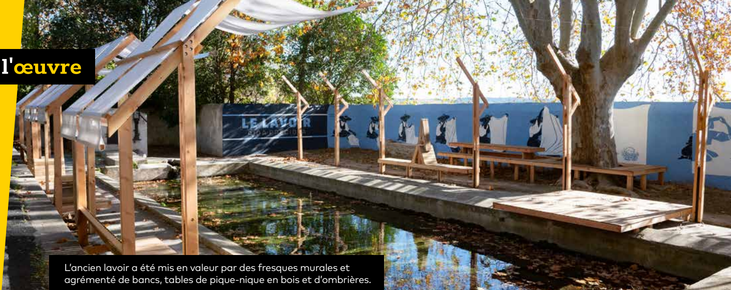
L'ancien lavoir a été mis en valeur par des fresques murales et agrémenté de bancs, tables de pique-nique en bois et d'ombrières.